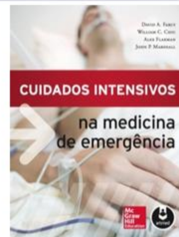
Cuidados Intensivos na Medicina de Emergência