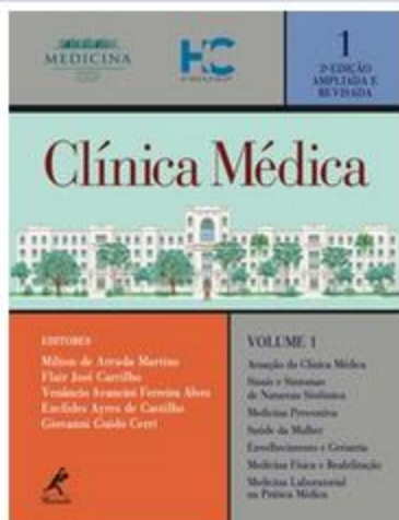
Clínica Médica, Volume 1: Atuação da Clínica Médic...