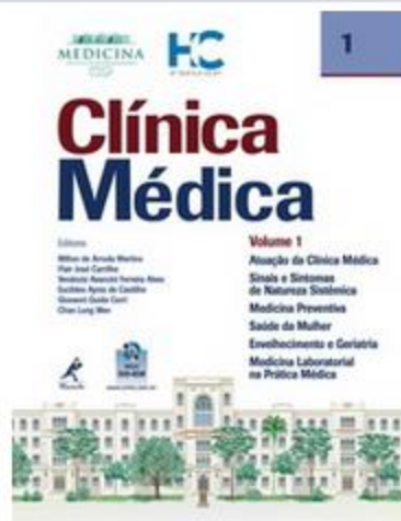
Clínica Médica, Volume 1: Atuação da Clínica Médic...