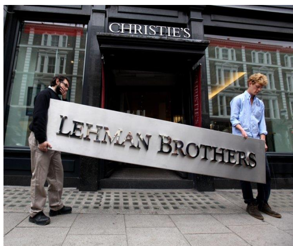
Paul Krugman (org.). A crise de 2008 e a economia da depressão . Rio de Janeiro, Campus, 2009.